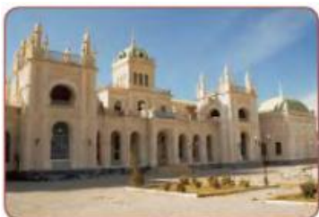
Buxoro amirligining saroyi (Kogon)