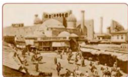
Samarqandning markaziy ko'chasi. XIX asr

Turkiston general-gubernatori fon Kaufman O'rta Osiyoni bosib olishni Buxoro amirligini qo'lga kiritish bilan davom ettirishga qaror qildi. Amirlikning harbiy kuchi Qo'qon xonligi bilan uzluksiz olib borilgan urushlar, ichki nizolar, zamonaviy harbiy texnikada ortda qolishi tufayli zaiflashgan edi. Fon Kaufman Buxoro amirligi chegaralarini puxta o'rganib chiqib, Amir Muzaffarga chegaraning Rossiya mulki foydasiga o'zgartirilgan yangi loyihasini tasdiqlashni taklif qildi. Amir Muzaffar bu shartnomani imzolashdan bosh tortdi. Shunda K. P. Kaufman uni general-gubernatorlik chegaralariga bostirib kirishga tayyorgarlik ko'rishda ayblab, 4 mingdan ziyod qo'shindan iborat harbiy otryad to'plab, 1868-yil aprelda Samarqandni bosib olishga kirishdi. Biroq K. P. Kaufmanning Amir Muzaffar qo'shinini