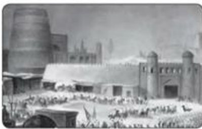
Podsho qo'shinlari Xiva ostonasida