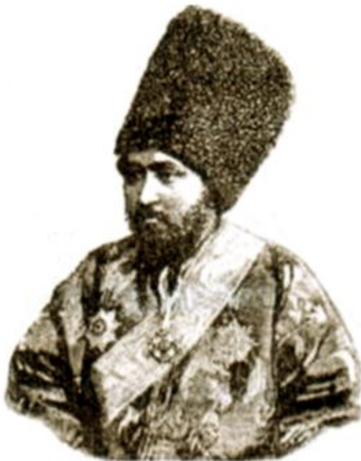
Xiva xoni Muhammad Rahimxon II