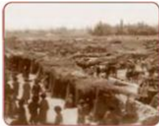
Xiva xonligidagi bozor

K. P. Kaufman Xivani bosib olgandan so'ng xon xazi-nasini kontributsiya (tovon) evaziga musodara qilib, xazina bilan birga qadimiy qo'lyozmalar, xonning taxti va toji, tanga zarb qiladigan tamg'a va zarb tasviri, qo'ng'iro't sulolasi xonlarining hokimiyati ramzlari va boshqa qo'lga kiritilgan moddiy boyliklarni Sankt-Peterburgga jo'natdi. K. P. Kaufman Xivani egallagandan so'ng Xiva xonligi bilan muzokaralar o'tkazish uchun Gandimiyon qishlog'idagi qarorgohiga bordi. U taklif etgan sulh shartnomasini Xiva xoni Muhammad Rahimxon II 1873-yil 12-avgustda imzolashga majbur bo'ldi. Ushbu shartnoma Xiva xoni Rossiya imperiyasi tobeligiga o'tganligini ko'rsatardi. Shartnomaning birinchi muddasida: «Sayid Rahim Bahodirxon o'zini Butun Rossiya imperatorining sodiq xodimi deb tan oladi. U qo'shni hukmdorlar va xonlar bilan har qanaqa bevosita do'stona munosabatlardan va ular bilan biron-bir