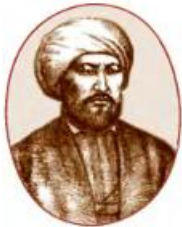
Qo'qon xoni Xudoyorxon

Andijon aholisi mudofaa janglarida shaharning har bir qarich yen uchun jon-jahdi bilan kurashdi. M. Skobelev boshchiligidagi qo'shinning dastlabki urinishlari jiddiy qarshilikka uch-radi. Shundan so'ng podsho hukumati qo'shinlari barcha imorat va xonadonlarga o't qo'yib, shaharni yong'in ichida qoldirdi. Shahar to'xtovsiz ravishda artilleriyadan o'qqa tutib turildi. Bu shahar himoyachilarini og'ir ahvolga solib qo'ydi. Uch soat davom etgan betinim o'qqa tutishdan so'ng kechqurun podsho hukumati qo'shinlari yana hujumga o'tdi. Lekin bu hujum ham natija bermadi. Erta tongdan bosh lab yana to'plardan kun bo'yi o'q yog'dirildi. Biroq shahar himoyachilarining qarshi hujumga o'tishi podsho qo'shinlarini chekinishga majbur qildi. Shahar 1876-yil yanvarda uyushtirilgan ikkinchi hujum natijasida qiyinchilik bilan egallandi.