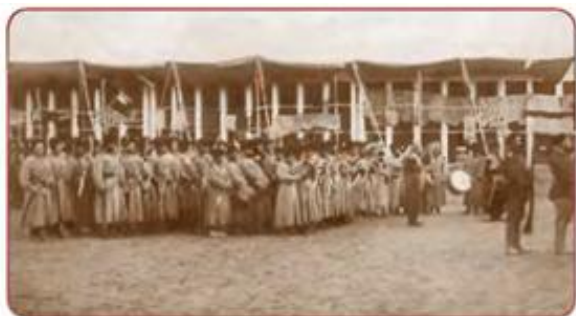
Buxoro harbiy qo‘shinlari

Toshkent shahri bosib olingandan so‘ng podsho hukumatining kelgusidagi rejasi xonliklarni navbat bilan bosib olish edi. Barcha harbiy harakatlar Toshkent shahridan turib tashkil qilindi va boshqarildi. Shu maqsadda, eng avvalo, xonliklarning birlashmasligiga qaratilgan siyosat olib borildi. Ya‘ni mustamlakachilar o‘zlarining asosiy qoidasi hisoblangan «Bo‘lib tashla, hukmronlik qil» shioriga amal qilishga kirishdi.